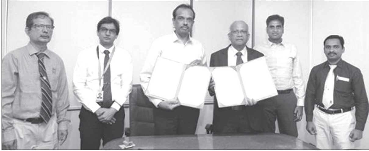
மணிபால் பல்கலைக்கழக துணைவேந்தருடன் புரிந்துணர்வு ஒப்பந்தம்..